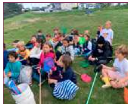
Groupe des CM - AME