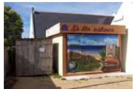
Le container des journaux se trouve à gauche du portail de l'école