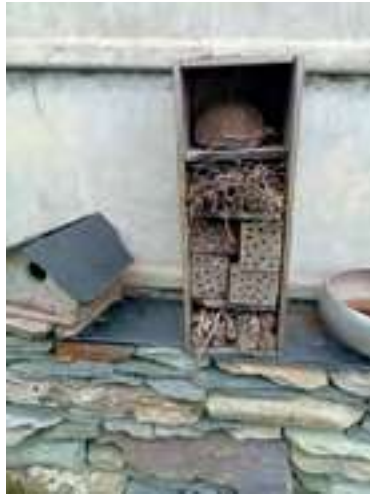
Hôtel à insecte avec une caisse en bois