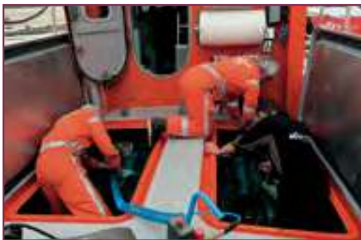
Bricolage sérieux sur Enez Glaz