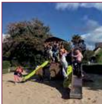
Structure de jeu