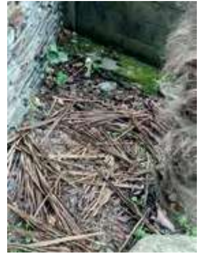
Paillage avec des palmes de palmier

• Pour les branchages plus importants, (les tailles des pruniers), je les range bien proprement le long du mur, dans une sorte de banc, selon les conseils de Tiphaine Hameau, jardinier de la Manu de Morlaix. C'est propre, et le tas se tasse au fil des mois, prêt à recevoir les branches de l'année suivante. On peut aussi simplement passer la tondeuse thermique dessus pour en faire du paillage.