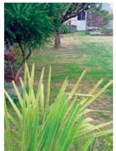
Vue d'ensemble du jardin