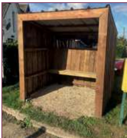
Abribus de la ligne scolaire réalisés par le service technique