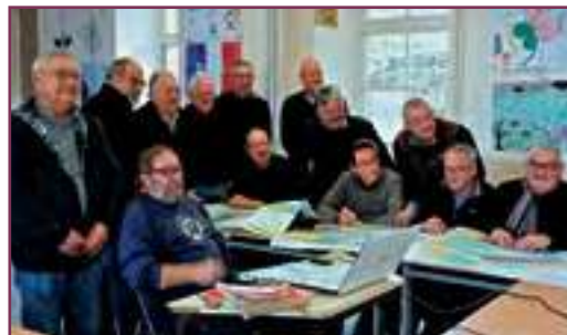
Initiation à la navigation auprès des pêcheurs plaisanciers

SNSM Locquirec - 39bis route de Morlaix - 29241 Locquirec - snsmlocquirec@orange.fr