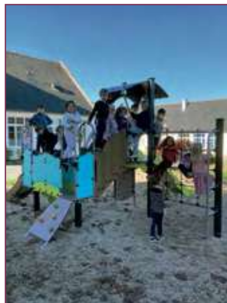
Nouvelle structure de jeux installée à l'école primaire Yvonne Folgalvez