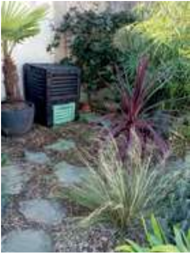
Composteur et paillage