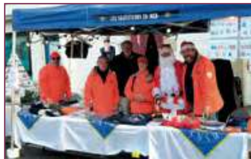
La force de vente au marché de Noël