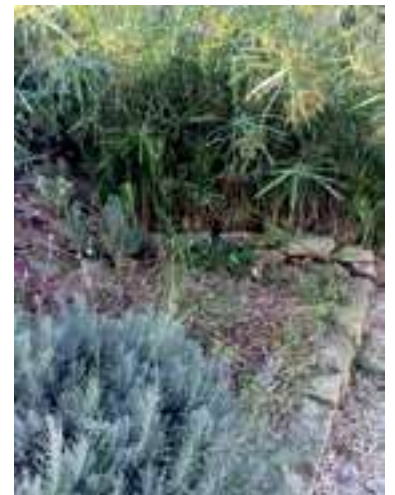
Papyrus et paillage