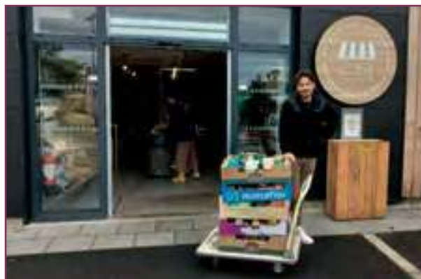
Résultat de la collecte au p'tit marché