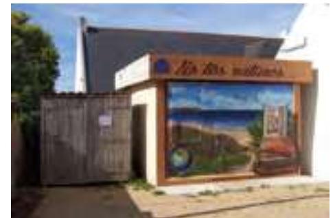
Le container des journaux se trouve à gauche du portail de l'école