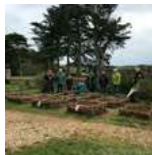
Jardin des simples