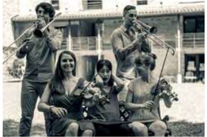
Autour de la musique baroque du 17e, à Plourin-les-Morlaix

Afin de fêter cet anniversaire, nous avons réuni une soixantaine d'artistes qui ont fait partie de la vie de l'association depuis ses débuts ainsi que des musiciens à découvrir. On y retrouvera comme les années précédentes dans une 15e de communes, les concerts dans l'après-midi et en soirée, des rencontres et des balades, pour finalement se rassembler autour du Magnificat de J-S Bach. Une production ambitieuse avec une vingtaine d'artistes sur le plateau, et la participation du Petit chœur de Son ar mein. Le clap de fin résonnera dans une cour d'école, où danse Renaissance et danse bretonne s'entremêleront le temps d'un bal.