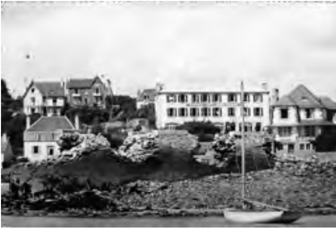
Le quai détruit devant l'Hôtel de Bretagne

Le 16 juin 1944, dix jours après le débarquement Allié en Normandie, les occupants, qui ne se faisaient plus guère d'illusion sur le sort qui les attendait, firent sauter le môle de LOCQUIREC au moyen de cinq charges d'explosif alors que celui-ci n'avait aucun intérêt stratégique.