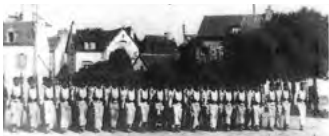
Marins du «Prinz Eugen» à l'exercice sur le port de Locquirec.

C'était le début du débarquement, mais pour deux autres copains cinq ou six ans plus âgés que moi et pour moi aussi une autre aventure commençait. C'était la visite aux bateaux de l'escorte.