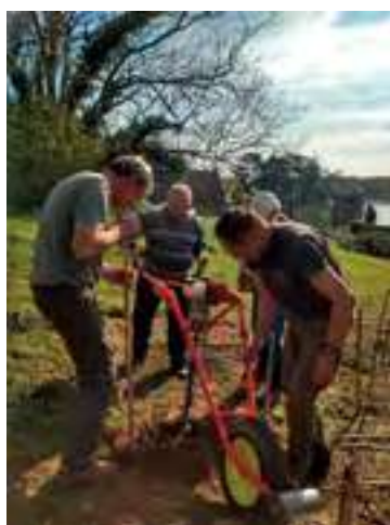
Palissage de la vigne