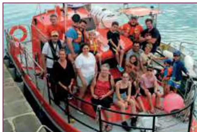
Sortie en mer pour les bénévoles et leurs familles

La fête de la SNSM aura lieu sur le port le jeudi 1er août à partir de 15h00, vous pourrez y assister à des démonstrations de sauvetage et faire des balades en mer sur les canots de la SNSM.